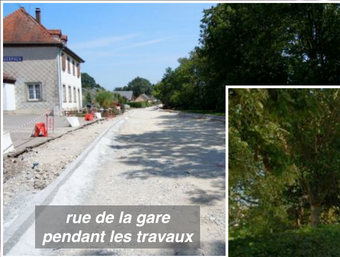
rue de la gare pendant les travaux