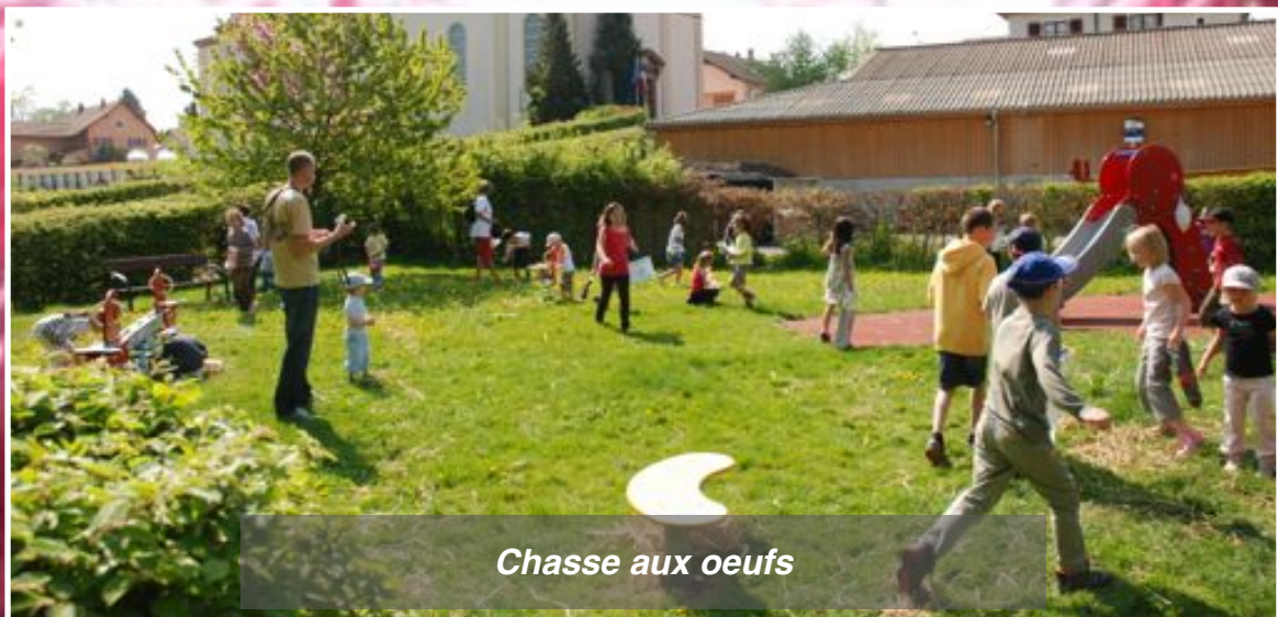
Chasse aux oeufs