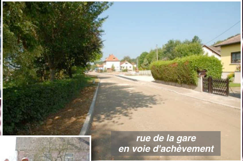
rue de la gare en voie d'achèvement