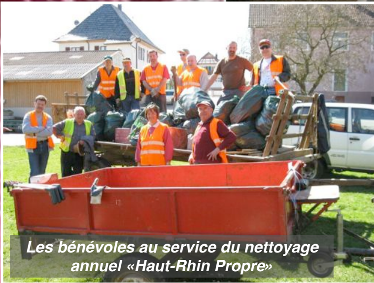
Les bénévoles au service du nettoyage annuel «Haut-Rhin Propre»