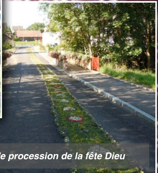
Chemin de procession de la fête Dieu