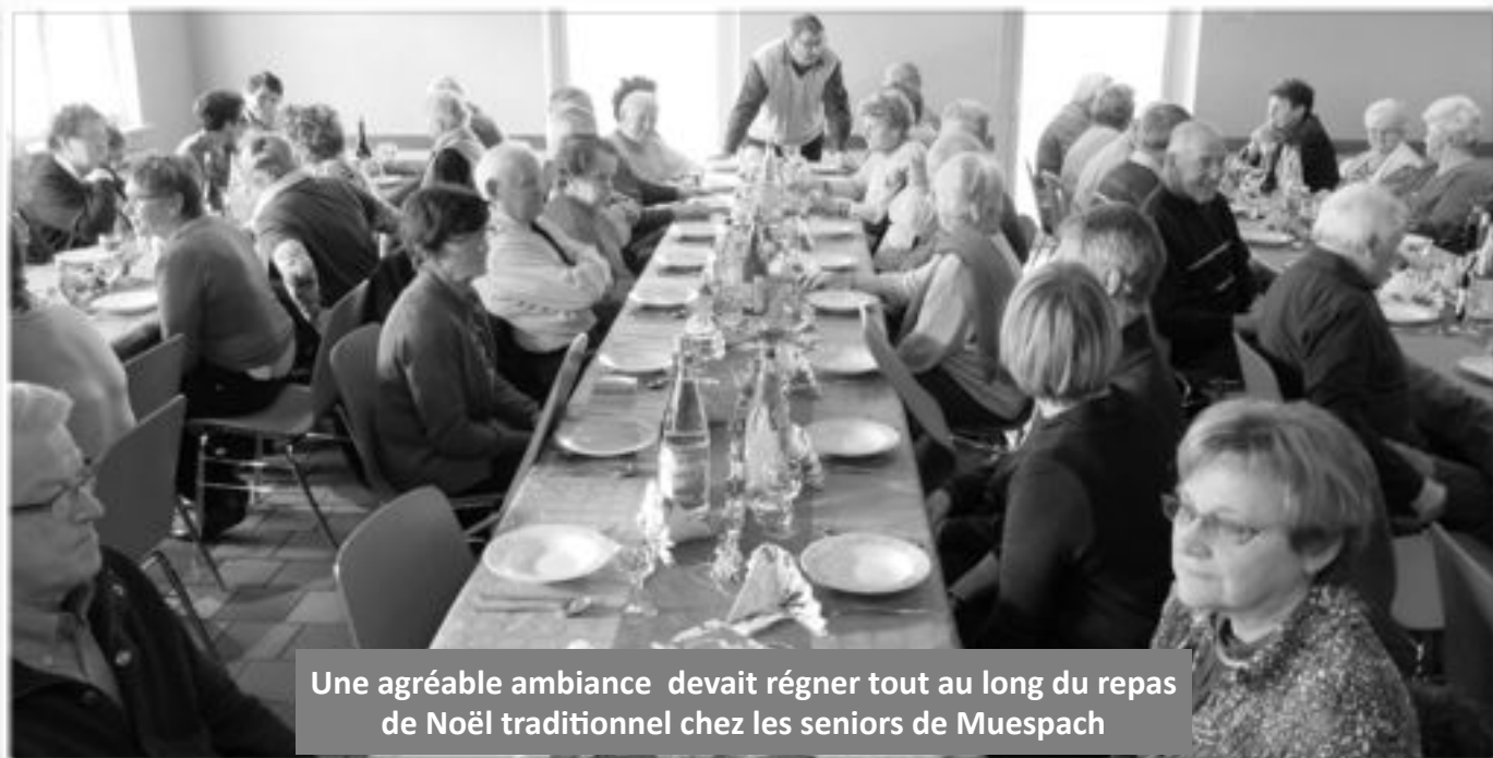
Une agréable ambiance devait régner tout au long du repas de Noël traditionnel chez les seniors de Muespach