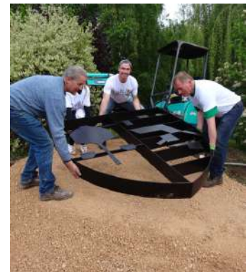
Pose du châssis