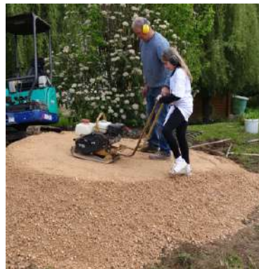
Transmission du savoir à sa fille