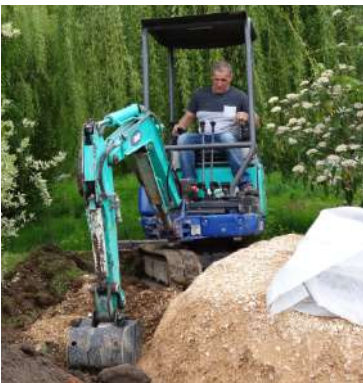
A la vitesse de l'éclair

Le résultat est superbe, l'œuvre en impose.