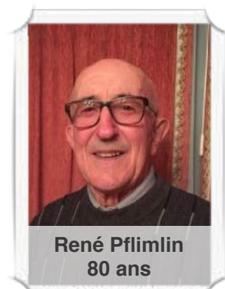
René Pflimlin 80 ans