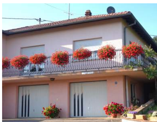
Famille Eugène Kreutter (2016)