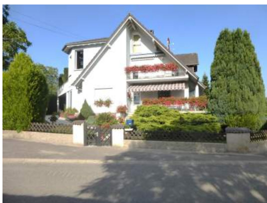
Famille Jean-Louis Goepfert (2016)

Attention! Des membres du Conseil Municipal vont bientôt sillonner les rues du village, appareil photo en main. Choyez vos plus belles fleurs et gagnez le prix de la plus belle maison fleurie du village. Cette année, la commune soumettra les 7 plus belles réalisations 2017 au Jury Départemental.